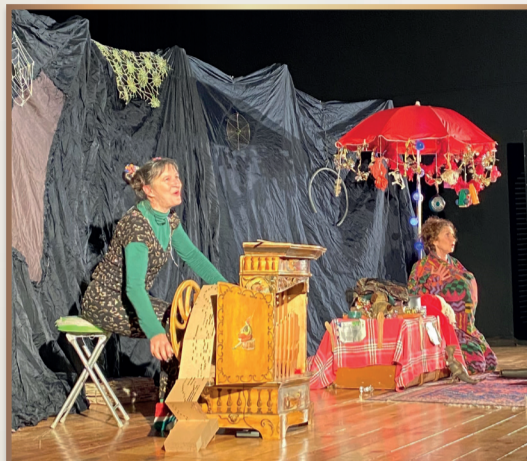
Le spectacle « Noël privé » destiné aux enfants a marqué le lancement des Festivités sur la commune mercredi 8 décembre.