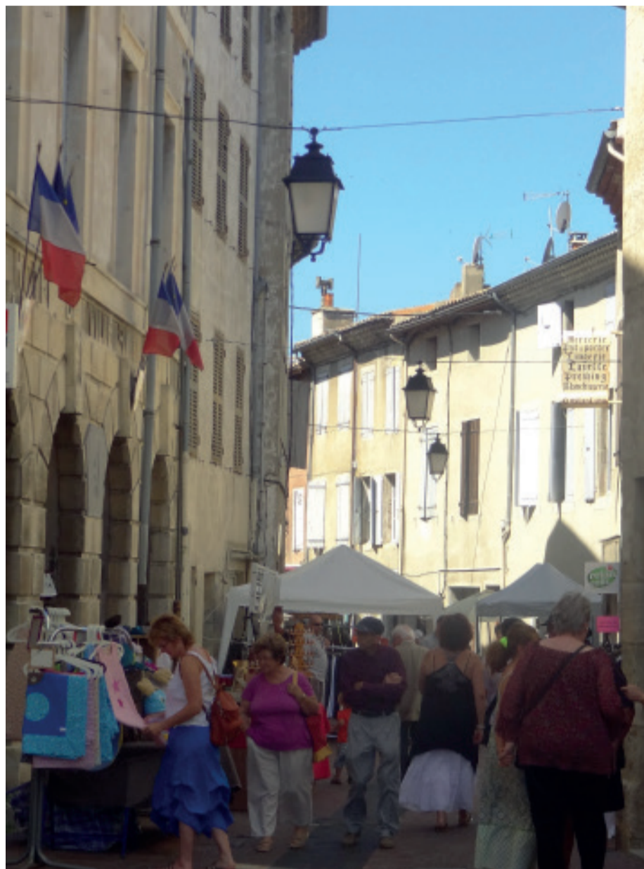
Marché artisanal organisé par l'ACAIL le long de la Grande Rue en 2012.