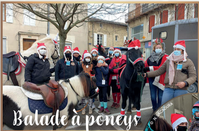
Balade à poneys