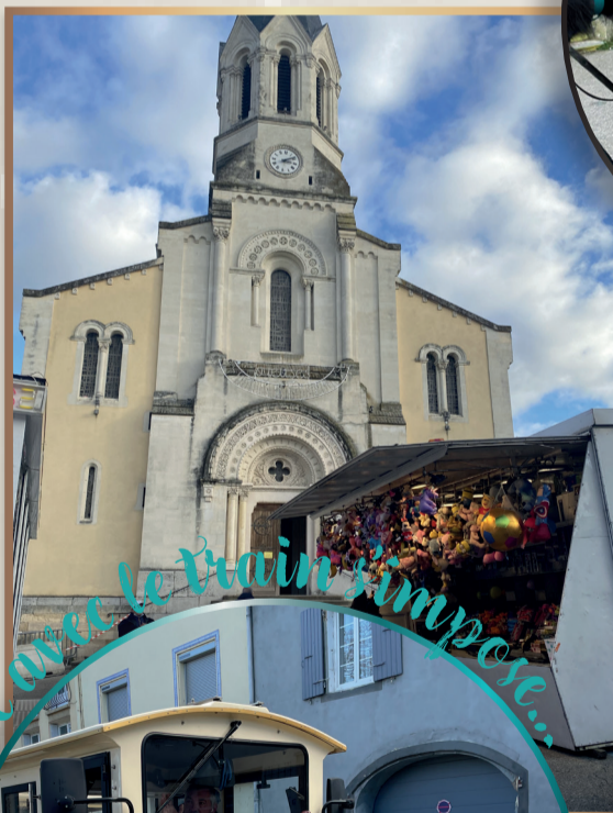
Une halte avec le train s'impose...