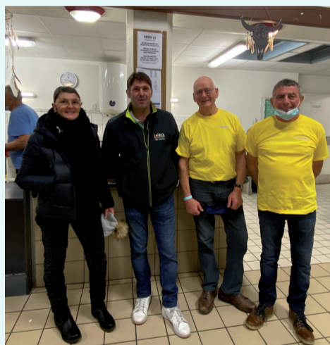
Au programme : danse country animée par l'association Clou's n'Loriol Country Road !