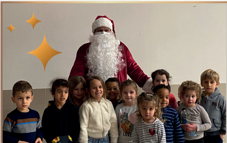
Les enfants ont reçu la visite d'un invité surprise à la fin du spectacle. Le père-Noël était présent avant de commencer la tournée des quartiers.