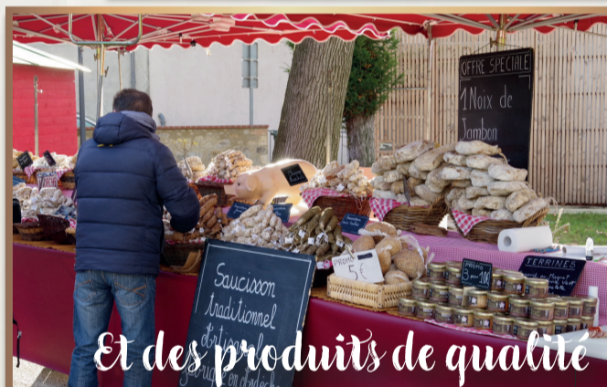
Et des produits de qualité