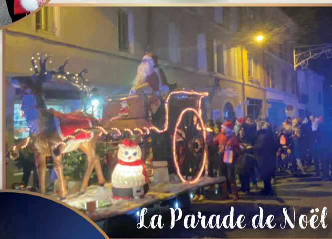
La Parade de Noël