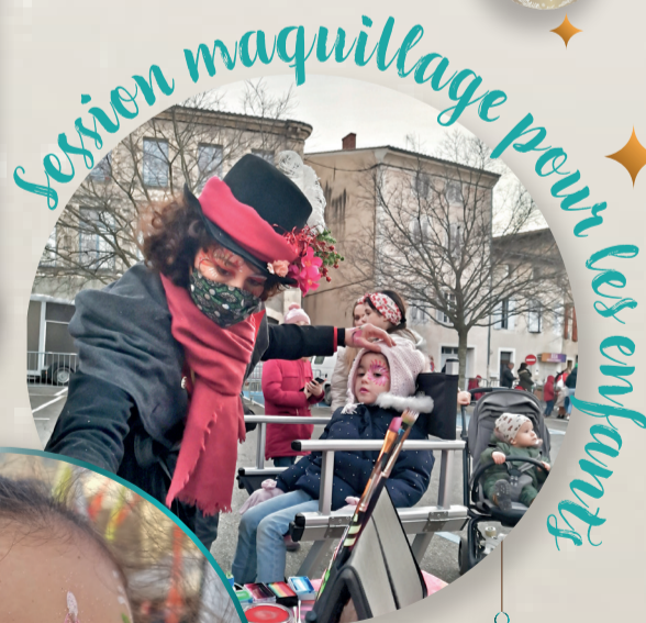
Session maquillage pour les enfants