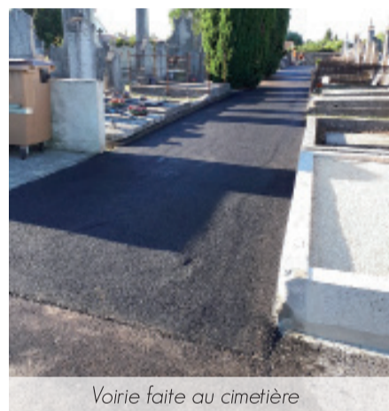
Voirie faite au cimetière