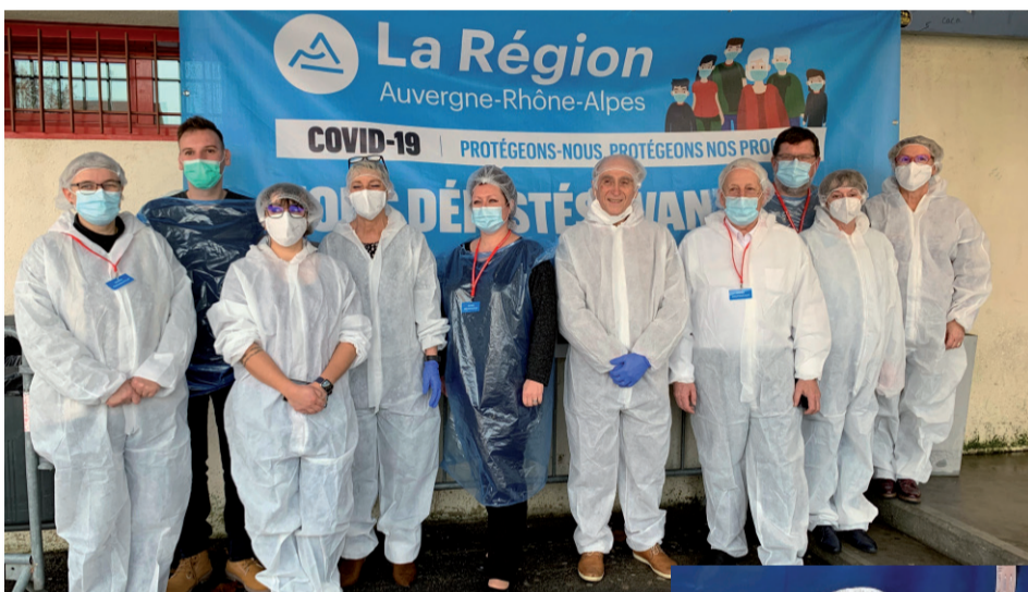
Le Maire entouré d'élus bénévoles, des professionnels de santé.