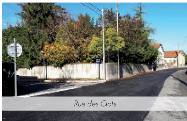
Rue des Clots