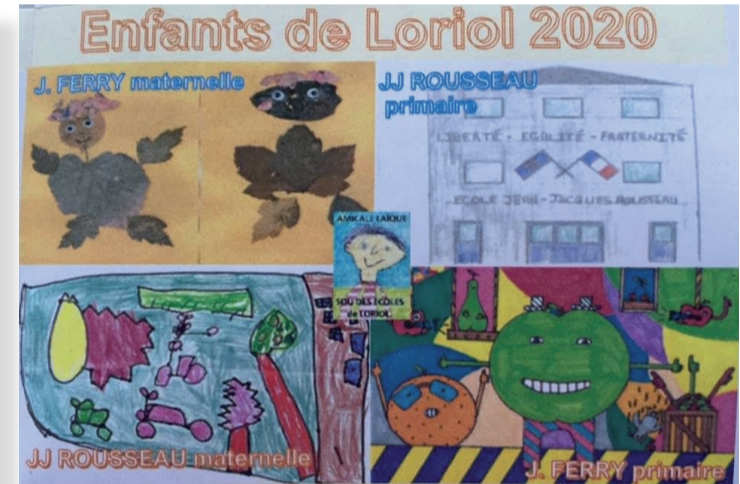
Les élèves ont joué le jeu en imaginant les étiquettes des produits vendus.