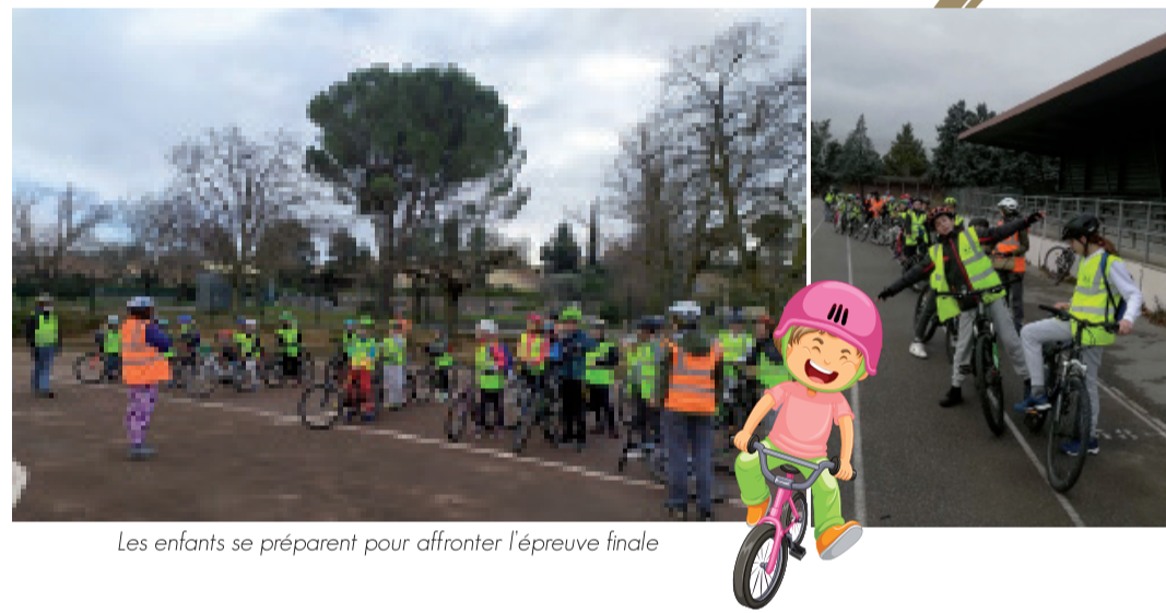
Les enfants se préparent pour affronter l'épreuve finale

Plusieurs sorties d'entraînement sont au programme et prévues les samedis et quelques mercredis afin d'appréhender ce projet de groupe au mieux.