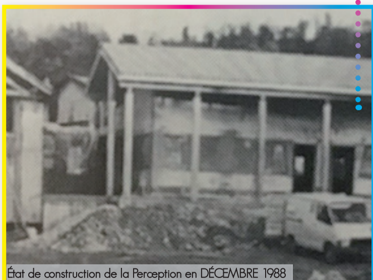
État de construction de la Perception en DÉCEMBRE 1988

Les locaux trop petits et vétustes de l'Immeuble de l'Ecureuil, Place du Champ de Mars, seront remplacés par une construction neuve Rue de la Schwalm : coût des travaux, 1 800 000 Fr, intégralement financés par un emprunt communal. Pendant 30 ans, 5 « Comptables du Trésor » se sont succédés avec des missions très variées telles que la vente de timbres de chasse, la souscription de bons du trésor, l'achat de valeurs cotées en bourse et bien entendu les missions de conseil auprès de particuliers ou la gestion des finances des collectivités locales. Désaffecté en 2019, ce site retrouve une seconde vie en offrant aux Loriolais, via le numérique, des services encore plus vastes que ceux initialement prévus.