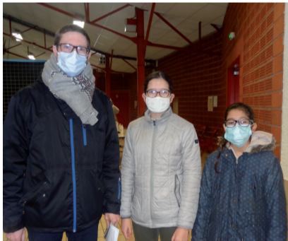
Une famille venue se faire dépister