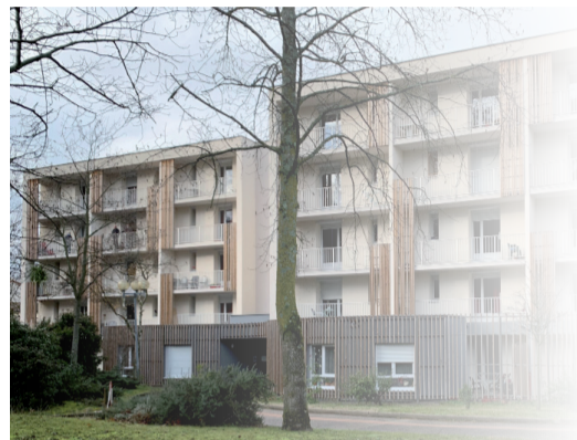
La Résidence Autonomie, un lieu où les résidents se sentent chez eux, dans un logement douillet et entourés de nombreux services.