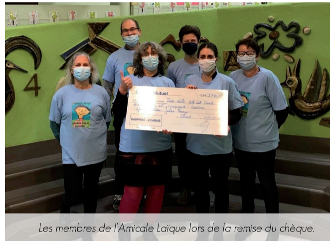
Les membres de l'Amicale Laïque lors de la remise du chèque.