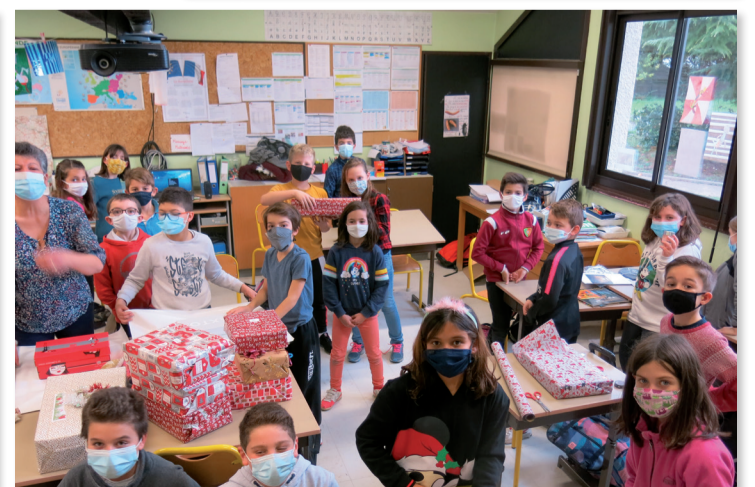
Les élèves des classes de CM1 et CM2, heureux de s'être montrés solidaires et d'avoir participé à cette noble cause.