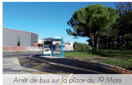
Arrêt de bus sur la place du 19 Mars