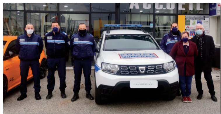
Depuis le 1 er janvier, un nouveau véhicule de service est arrivé en remplacement d'un véhicule plus ancien.

Suite à un sentiment d'insécurité grandissant de la population, la municipalité a décidé en 2007 d'expérimenter l'usage de la vidéo-protection. Des caméras ont donc été installées dans le centre-ville. Grâce à celles-ci, de nombreuses affaires ont pu être résolues par la gendarmerie et une diminution importante des dégradations des biens publics ou privés et des vols a été constatée.