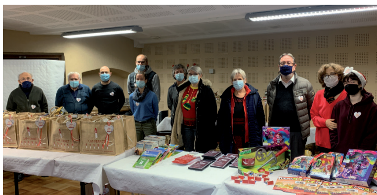
Les bénévoles du Noël du Cœur se sont relayés toute la journée du 24 décembre.