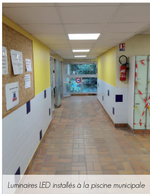
Luminaires LED installés à la piscine municipale